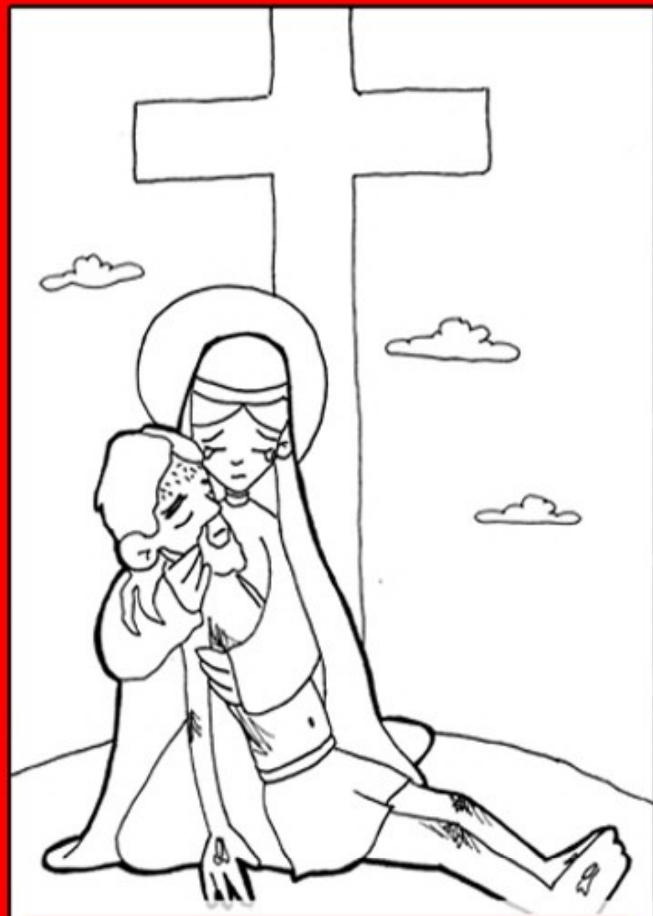
FRA LE BRACCIA DI MARIA