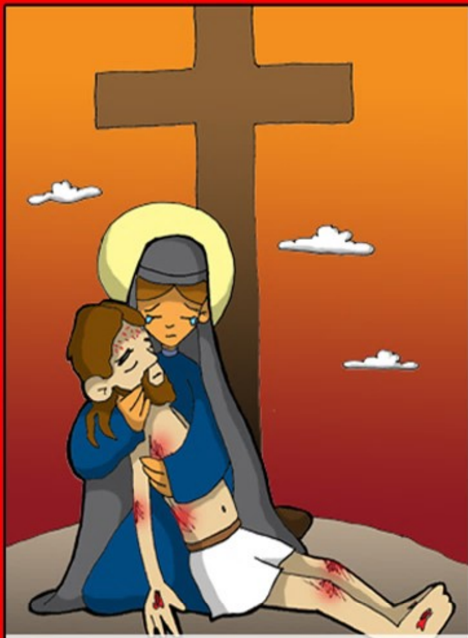
FRA LE BRACCIA DI MARIA