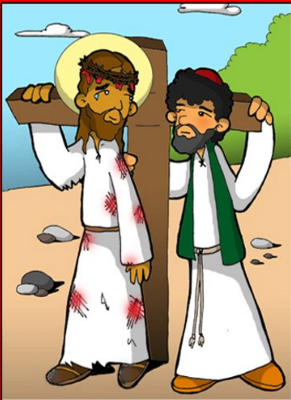
AIUTATO DA SIMONE