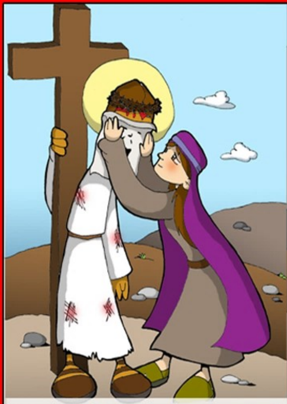
VERONICA ASCIUGA IL VOLTO