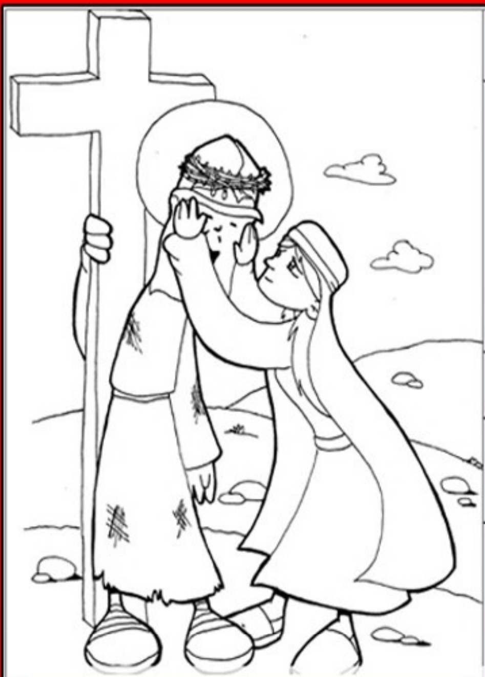
VERONICA ASCIUGA IL VOLTO